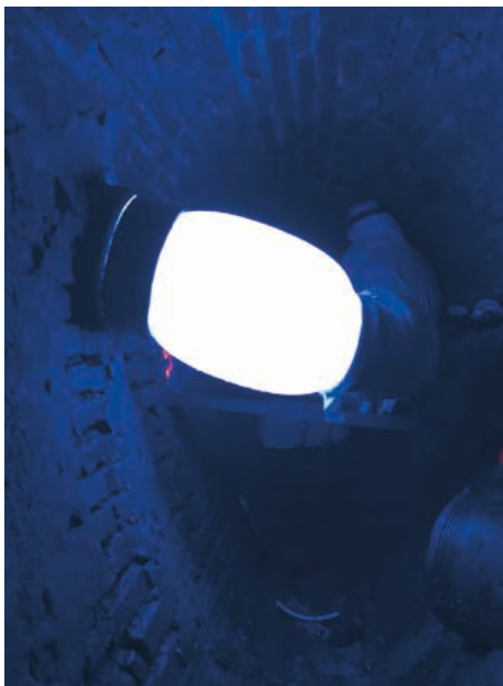
Besonders unter engen Verhältnissen ist das Bluelight-LED-System eine gute Wahl.