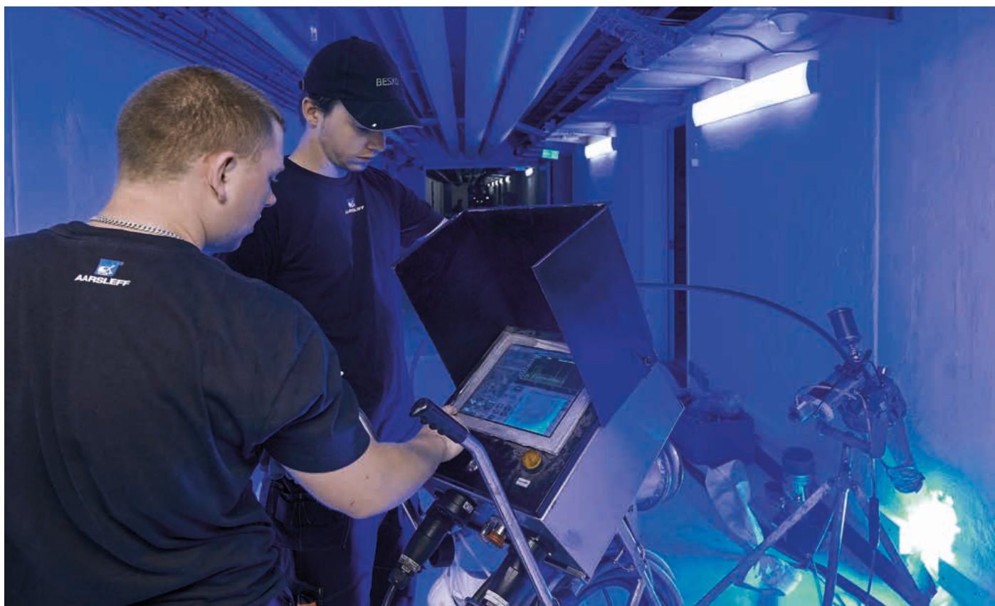
Sonderfall: Auch bei Schlauchliner-Renovationen aus dem begehbaren Hauptkanal ist das LED-System einsetzbar.

Ende 2015 wurde die Bluelight GmbH als Tochterunternehmen der Aarsleff Rohrsanierung GmbH mit dem Ziel gegründet, LED-Gerätetechnik und zugehörige Schlauchli-