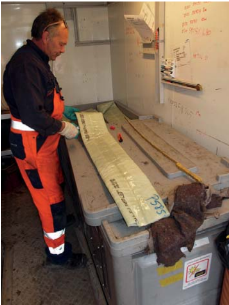
Zuschnitt F-Liner auf Einbaulänge direkt vor Installationsbeginn