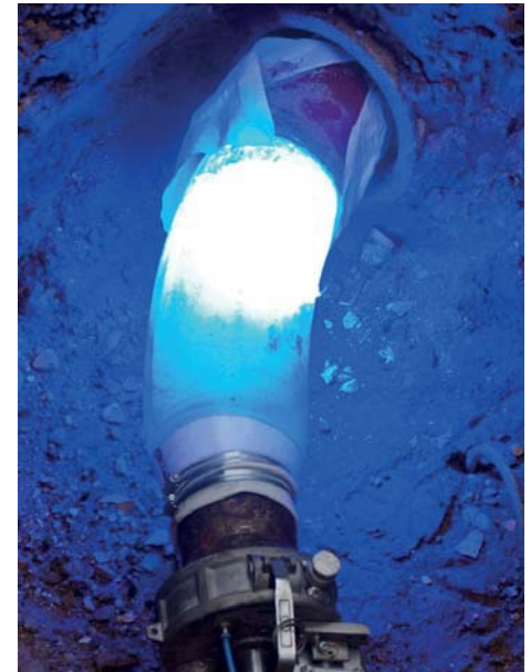
Härtung mit blauem Licht der Wellenlänge 450 nm

Der F-Liner wird werksseitig nach industriellem Standard imprägniert und besteht aus einem styrolfreien Vinylesterharz in Verbindung mit einem flexiblen Polyesterträgerschlauch sowie einer PU-Innenbeschichtung. Nach dem Einbau des Preliners erfolgt die Inversion mit Luftdruck und einer speziellen Einbaukugel. Offene Enden sind unter Verwendung eines flexiblen und lichtdurchlässigen Stützschlauches möglich. Der LED-Kopf wird über eine in der Einbaukugel integrierte Schleuse bis zum Ende des Liners geschoben und mit der im Lichter-Kopf integrierten Kamera kontrolliert. Nach Aktivierung der blauen Lichtquelle wird der Liner schließlich beim Zurückziehen mit definierter und automatisch per Motor gesteuerter Zuggeschwindigkeit ausgehärtet. Die reine Aushärtezeit liegt bei durchschnittlichen Längen von ca. 8 m und einer Nennweite von DN 150 mm bei etwa 10 Minuten.