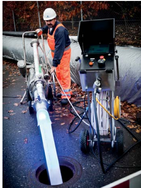
In Dänemark bereits seit Jahren erfolgreich eingesetzt.