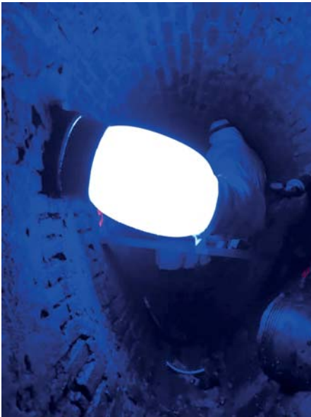
Auch bei Schlauchliner-Renovationen aus einem begehbaren Abwasserkanal ist das Bluelight LED-System im Sonderfall einsetzbar.