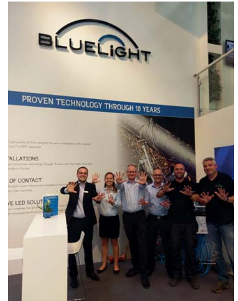
Das Bluelight-Team zum Ende der IFAT 2018 nach dem sensationellen Verkauf von 10 LED-System-Anlagen auf der Messe.

Bluelight Lichtquellen und die zugehörigen Schlauchliner ermöglichen Installationen durch 90-Grad-Bögen. Mit der Systemtechnik lassen sich zwischenzeitlich bis zu 95 Meter am Stück installieren.