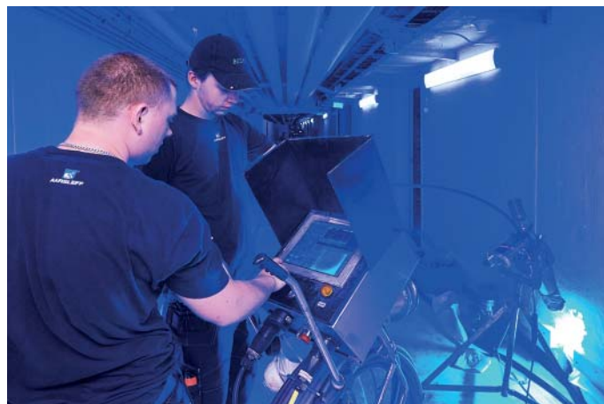
Unter engen Verhältnissen ist das Bluelight LED-System eine gute Wahl.

Per Aarsleff A/S greift als Hersteller und