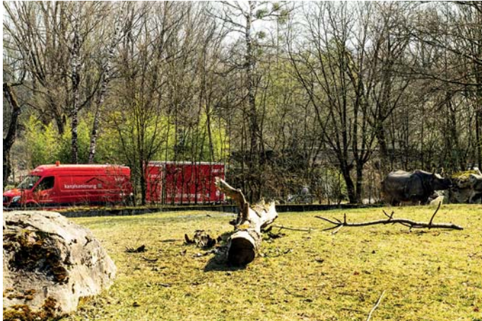
Anspruchsvolle Sanierungsumgebung im Tierpark Hellabrunn

Im Münchner Tierpark Hellabrunn wurden durch die bendl Kanalsanierung rund 1,5 km Abwasserleitungen der Dimensionen 150 mm bis 300 mm in kürzester Zeit renoviert. Während der Arbeiten wurde der Tierpark von bis zu 8.000 Menschen pro Tag besucht. Durch das Einsetzen von Lichtaushärtungssystemen meisterte das bendl-Experten-Team diese Herausforderung einwandfrei. Das Bluelight LED System half bei dieser besonderen Aufgabenstellung durch hohe Flexibilität, geringen Platzbedarf der Einbautechnik bei höchster Mobilität der Gerätschaften und durch die Zuverlässigkeit von Aushärte- und Schlauchlinertechnik.