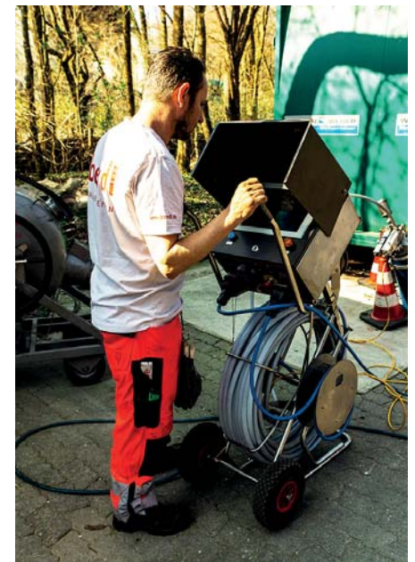
Kontrolle der Bluelight-Aushärtung

Gegenüber flexiblen und warmhärtenden Schlauchlinersystemen zeichnet sich das Bluelight LED System durch deutlich höhere Aushärtegeschwindigkeiten, eine Kamerakontrollmöglichkeit der Schlauchliner vor der Aushärtung, die Lagerstabilität von imprägnierten Schlauchlinern, die vollautomatische Qualitätssicherung und Dokumentation aller relevanten Parameter, weniger Abfall und der Reduktion von Fehlerpotentialen aus. Die Schlauchliner sind mit einem styrolfreien und nahezu geruchslosen Vinylesterharz imprägniert. Das