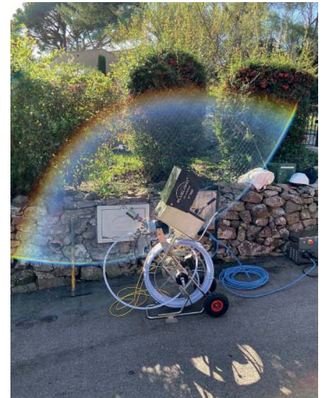
Bluelight Anlage nummer 100 – seit Herbst 2019 im Einsatz in Frankreich

Die Kombination von Erfahrung und Knowhow der bendl Kanalsanierungs-Experten mit den Vorteilen des Bluelight LED Systems führte zu höchster Produktendqualität, bei gleichzeitig hoher Wirtschaftlichkeit und minimalster Beeinträchtigung der sensiblen Umgebung.